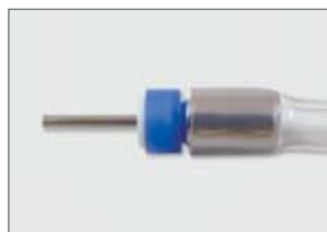
バルブ付カニューレに接続した状態